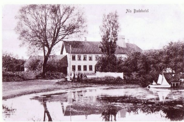
Et billede af Flouen, som den tog sig ud i gamle dage. I baggrunden Als Kro og Badehotel

Samtidig har arkitekterne og ingeniørerne påpeget at en helhedsløsning for Als også vil omfatte området ved Flouen, og hele det virvar af veje, der er om gadekæret. Der bør ske en omlægning af vejnettet, så hele området bliver mere indbydende med beplantning og åbning ned til Flouen, så der bliver større mulighed for at udnytte arealet ned til gadekæret – akkurat som man gjorde i gamle dage – samtidig foreslås det, at vejbelægningen ændres.